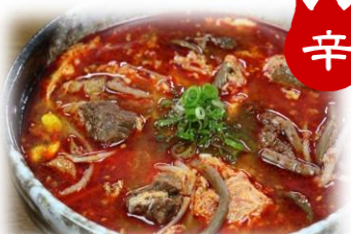
カルビスープ 880円 (税込968円)