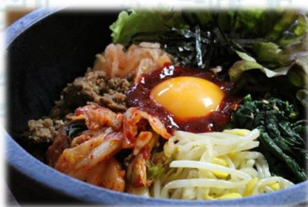
石焼ビビンバ 980円(税込1,078円)