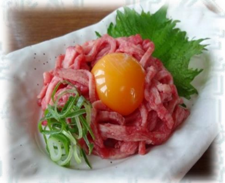
タンユッケ 1080円 (税込1,188円)

生ものご注文のお客様 一般に生ものは食中毒のリスクがあります。 お子様やご高齢の方、抵抗力の弱い病中・病後はお控えください。