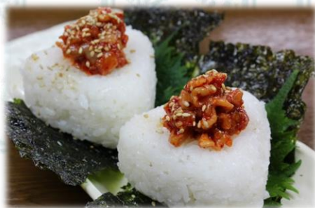
チャンジャおにぎり 550円(税込600円)