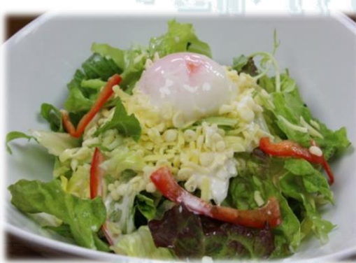
たまチーザーサラダ