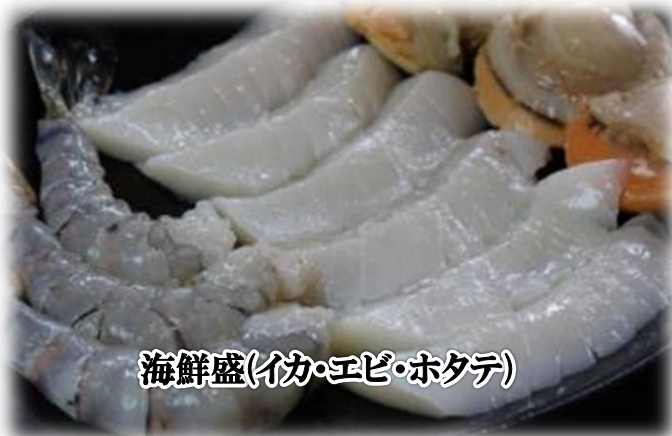
海鮮盛(イカ・エビ・ホタテ)