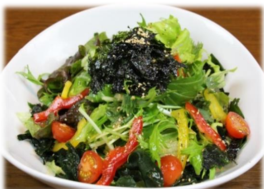
焼肉に合うサラダ