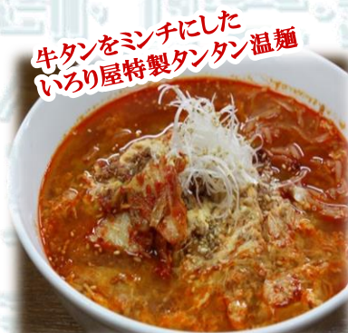
タンタン温麺 880円 (税込968円)