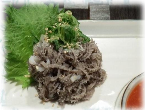
生センマイ 980円 (税込1,078円)