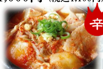
豆腐チゲ 780円 (税込858円)