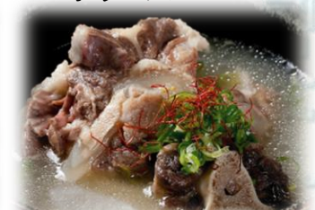
テールスープ 1,000円 (税込1,100円)