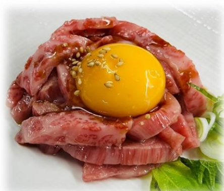
黒毛和牛炙りユッケ 1,380円 (1,518円)