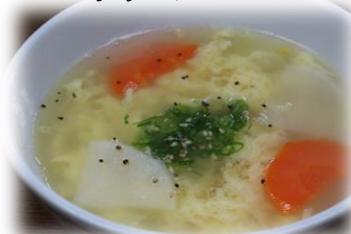
たまごスープ 360円 (税込396円)