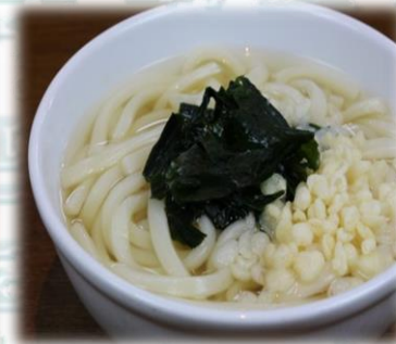
うどん 350円 (税込385円)