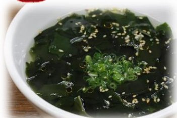
ワカメスープ 350円 (税込385円)