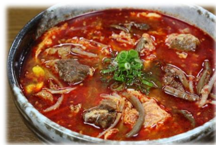
カルビクッパ 980円(税込1,078円)