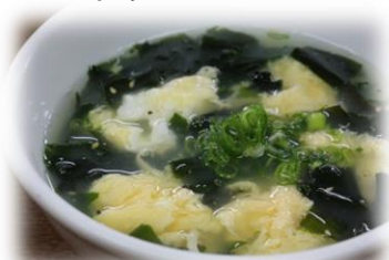
ワカメたまごスープ 430円 (税込473円)